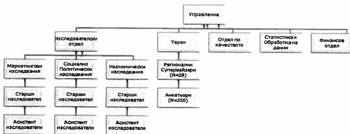
Фиг. 1: Организационна структура на Алфа Рисърч

Алфа Рисърч поддържа собствена анкетърска мрежа, която покрива цялата територия на страната. Анкетърската мрежа се състои от 350 обучени анкетъори под контрола на 28 регионални супервайзери. (виж Фигура 2).